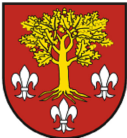
Starostwo Powiatowe w Poddębicach

Szkoła Podstawowa nr 1 im. Lotników Polskich w Poddębicach