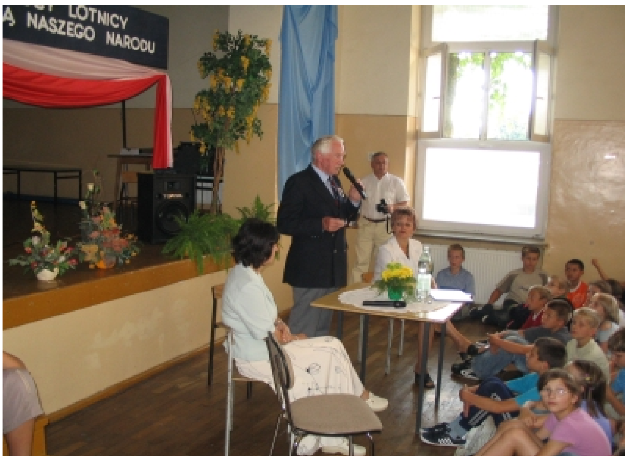
Mjr Jerzy Mencil podczas spotkania z uczniami szkoły, 5 września 2005 r.

W swoich działaniach Szkoła Podstawowa nr 1 im. Lotników Polskich w Poddębicach stara się łączyć wymagania współczesności z tradycją i historią, z której jesteśmy szczególnie dumni. Znalazło to swój oddźwięk w osobie patrona szkoły.