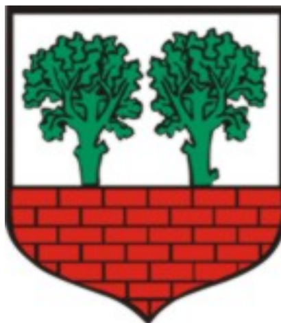
Urząd Miejski w Poddębicach